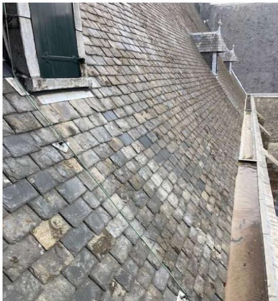
8. Aanzicht dak zuidzijde (dakvlak 3)

P. Backx vicevoorzitter incl. aanspreekpunt gebouwen parochiebestuur.