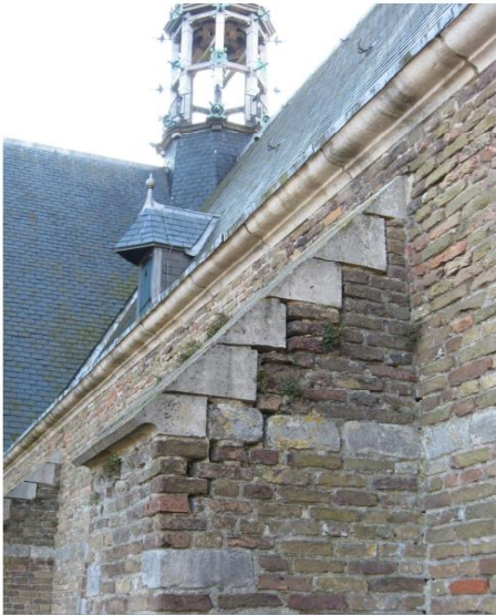
4. Detailfoto verzwakte metselwerk steunbeer gevel 6

Het resterende gedeelte van ca € 200.000,- moeten we zelf betalen.